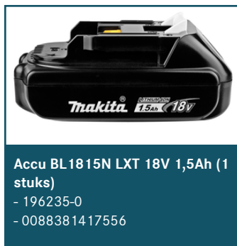
Accu BL1815N LXT 18V 1,5Ah (1 stuks) - 196235-0 - 0088381417556