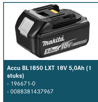
Accu BL1850 LXT 18V 5,0Ah (1 stuks) - 196671-0 - 0088381437967