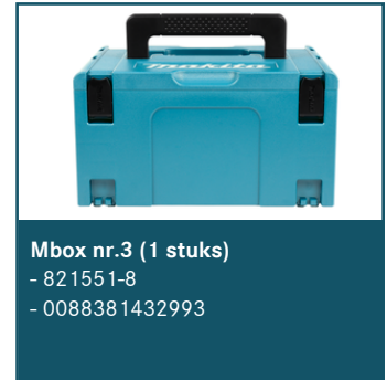
Mbox nr.3 (1 stuks) - 821551-8 - 0088381432993