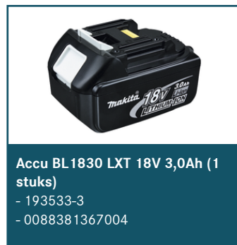
Accu BL1830 LXT 18V 3,0Ah (1 stuks) - 193533-3 - 0088381367004